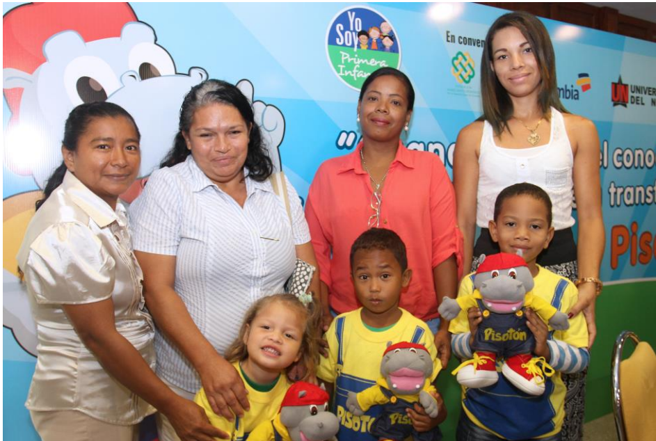
Madres comunitarias y niños beneficiados con Pisotón asistieron al lanzamiento del convenio.

1.400 madres comunitarias de los Departamentos del Atlántico, Caldas, Cundinamarca, Chocó, Guajira, Meta y Santander participarán en el Diplomado en Educación y Desarrollo Psicoafectivo de la Primera Infancia, gracias a un convenio entre el ICBF y la Universidad del Norte, por un valor de $2.790 millones de pesos, el cual cuenta con el apoyo de las Fundaciones Mario Santo Domingo y Bancolombia.