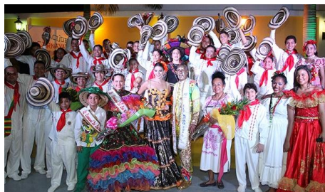
Al lanzamiento del cd asistieron la reina del Carnaval, el rey Momo y Totó La Momposina.

Niños del programa "Del Carnaval al Aula" presentaron su primer trabajo musical