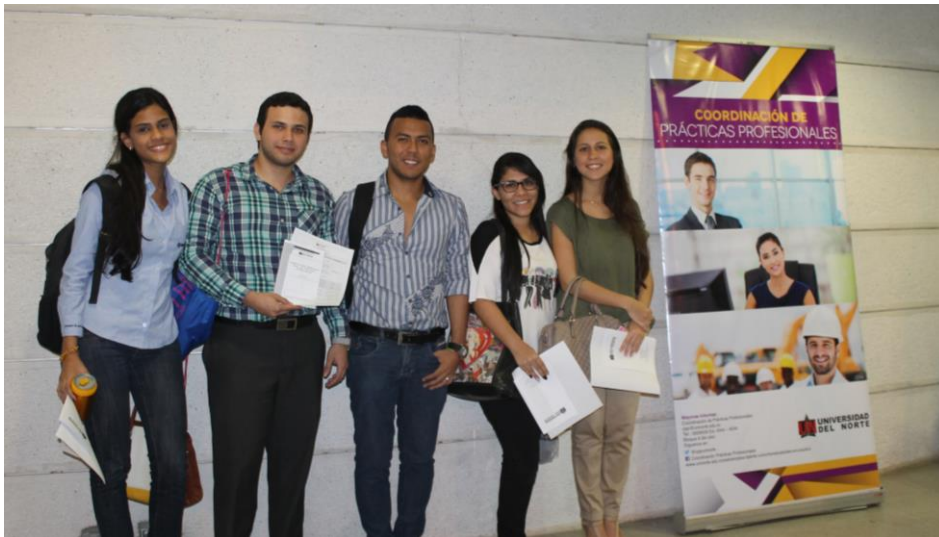
Estudiantes de Ingenierías y Diseño Industrial durante el evento