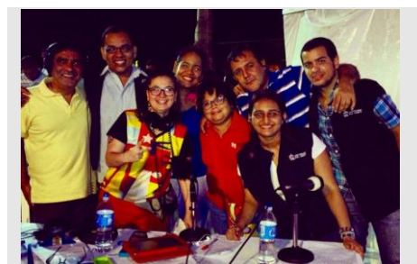
El equipo de Uninorte FM Estéreo durante la transmisión.

Durante el especial, se contó con la participación de la gran Petrona Martínez, quien antes de su presentación envió un saludo especial a los oyentes de Uninorte FM, sintonizados en diferentes puntos de la ciudad, del país y de otros lugares del mundo como México, Estados Unidos y Perú. Esta gala fue el escenario perfecto para llevar a distintos lugares la tradición y el folclor, pero también las emociones que confluyen en este tipo de manifestaciones.