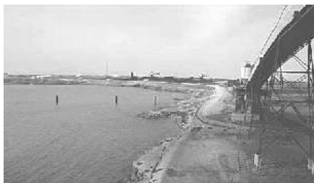
Panorámica del puerto y la mina de Carbones del Cerrejón LLC

A propósito del traslado a Bogotá, de empresas de la talla de Carbones del Cerrejón LLC y Fedco, se hace urgente cuestionarse qué motiva la migración empresarial, y qué pasa con el atractivo y las condiciones que ofrece Barranquilla como sede para la inversión.