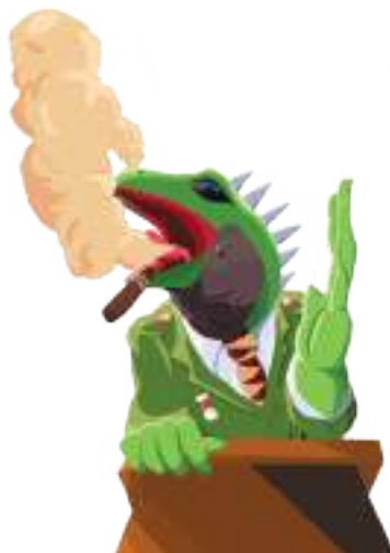
Ilustración: Diego Fernando Ulloque Balza