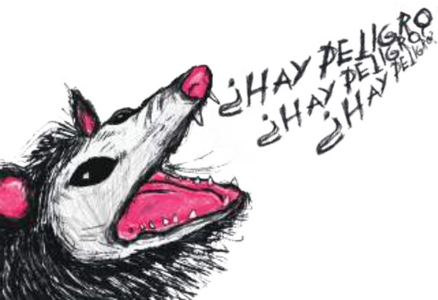
Ilustración: Andrea Díaz Ojeda