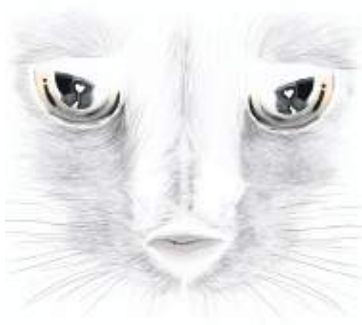
Ilustración: Cristian Chaparro Quijano