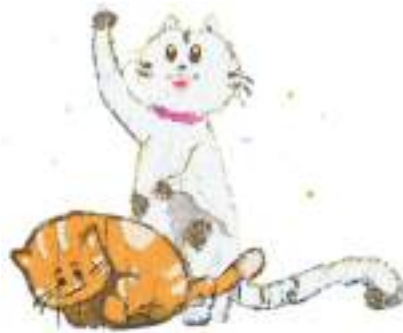
Ilustración: Keivys Ávila