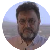
Carlos Arturo Gómez Pavajeau Ex Viceprocurador General de la Nación