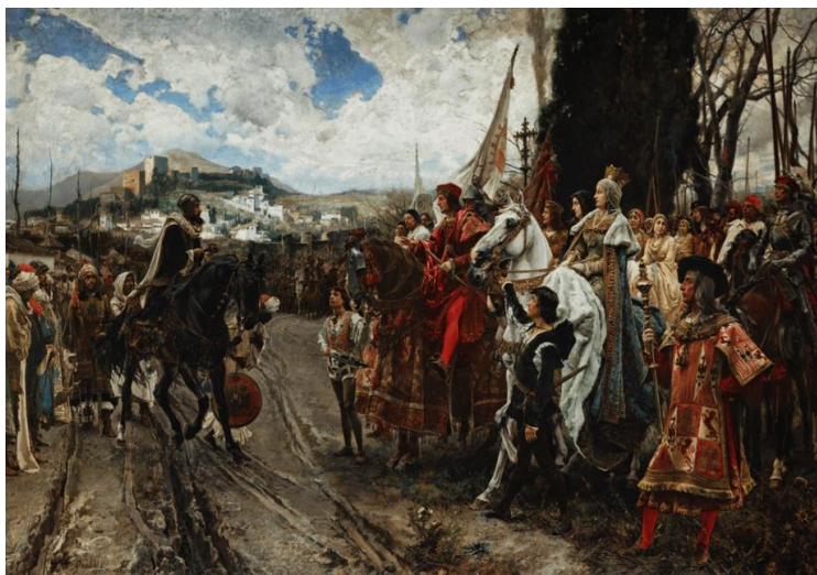
La rendición de Granada de Francisco Pradilla, óleo sobre lienzo, 1882. Sala de Conferencias del Palacio del Senado de España.

La pintura resalta el instante en el que, tras su derrota en la Guerra de Granada, el rey Boabdil, miembro de la dinastía nazarí, entrega las llaves de la ciudad a los reyes católicos, Isabel I de Castilla y Fernando II de Aragón, el 2 de enero de 1492. Cabe recordar que este es el mismo año en el que Colón emprende el viaje a la India y llega a América.