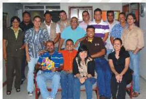
CENTRO DE PRODUCCIÓN AUDIOVISUAL Favorecidos en el sorteo de Referidos por Funcionarios