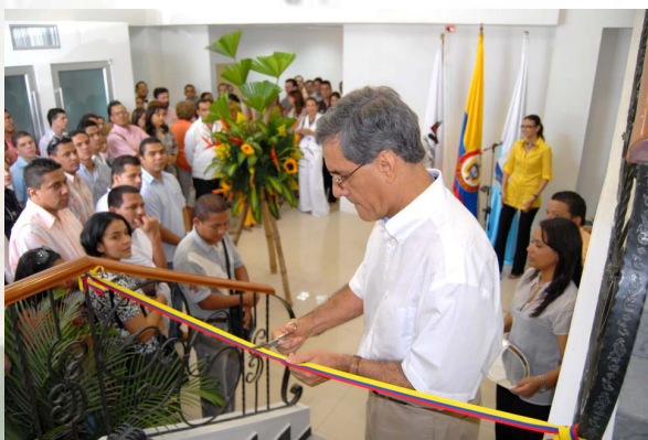
El Rector, cuando cortaba la cinta que oficializó la inauguración de la Sede de Postgrados en Santa Marta.

Desde el 29 de febrero de 2008, cuando oficialmente ante la comunidad samaria se anunció la noticia de que Uninorte ofrecería algunos de sus programas de postgrado en la capital del Magdalena, transcurrieron algo más de seis meses durante los cuales se contactaron alrededor de mil personas interesadas en adelantar estudios de postgrados en la Institución. La Sede Santa Marta de la Universidad del Norte es desde agosto del mismo año una realidad.