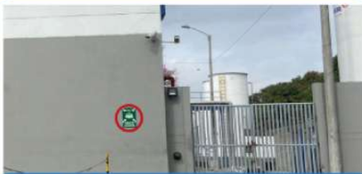
Salida de Urgencias