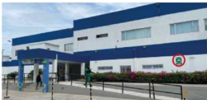
Salida de consulta externa