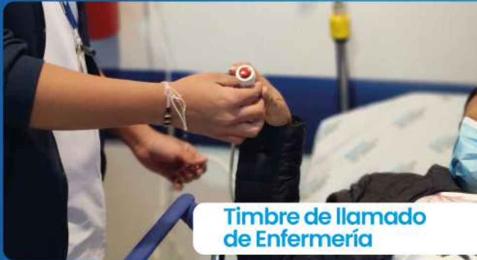
Timbre de llamado de Enfermería