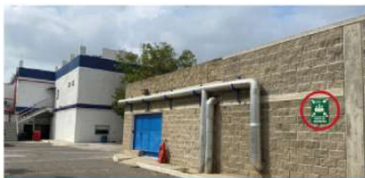
Patio de mantenimientos