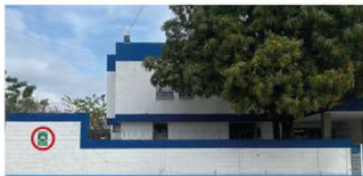
Salida de Hospitalización