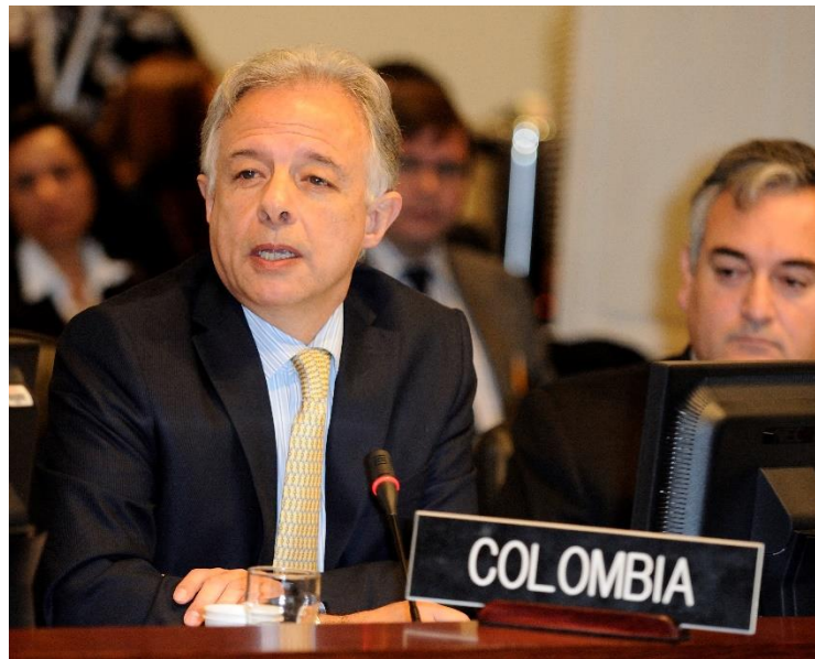
Andrés González Díaz

Exembajador ante la Organización de Estados Americanos (OEA)