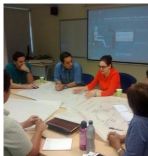
Desarrollo de la clase en el diplomado de Co-Creación e innovación Tic