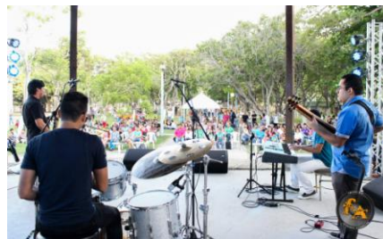
Vereda Jazz, ganador en la categoría jazz