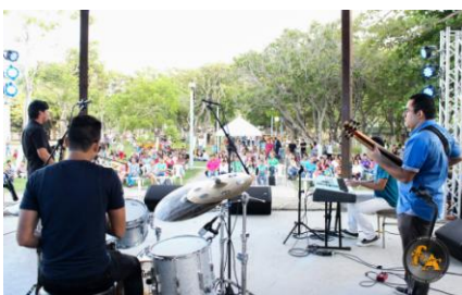
Vereda Jazz, ganador en la categoría jazz