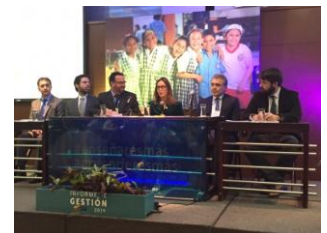
Intervención de la Ministra de Educación Gina Parody

Como parte del proyecto "Rectores líderes transformadores", que el CEC y el IESE han venido trabajando con rectores de la ciudad de Santa Marta, el Centro de Educación Continuada fue invitado a participar en la XIII Asamblea de Empresarios por la Educación, que tuvo como propósito presentar los avances, logros y retos de la Fundación en estos 13 años de trabajo en pro de la calidad de la educación en el país. Dentro de los paneles desarrollados en la jornada, participaron la Ministra de Educación Gina Parody, invitados internacionales latinoamericanos, expertos en temas de liderazgo escolar, evaluación docente y escolar; empresarios, secretarios de educación; investigadores académicos y rectores, entre otros.