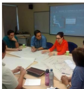
Desarrollo de la clase en el diplomado de Co-Creación e innovación Tic