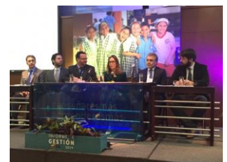
Intervención de la Ministra de Educación Gina Parody

Como parte del proyecto "Rectores líderes transformadores", que el CEC y el IESE han venido trabajando con rectores de la ciudad de Santa Marta, el Centro de Educación Continuada fue invitado a participar en la XIII Asamblea de Empresarios por la Educación, que tuvo como propósito presentar los avances, logros y retos de la Fundación en estos 13 años de trabajo en pro de la calidad de la educación en el país. Dentro de los paneles desarrollados en la jornada, participaron la Ministra de Educación Gina Parody, invitados internacionales latinoamericanos, expertos en temas de liderazgo escolar, evaluación docente y escolar; empresarios, secretarios de educación; investigadores académicos y rectores, entre otros.