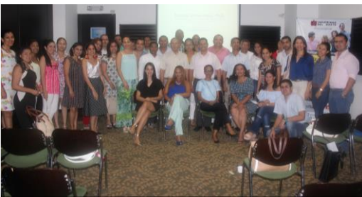
Egresados en Valledupar