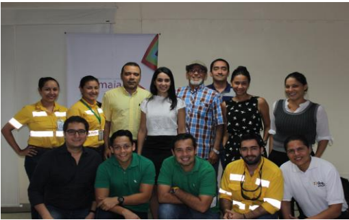
Egresados del Cerrejón