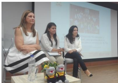
Invitadas durante la sesión de preguntas.