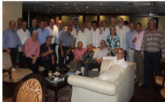
Grupo de egresados de Ingeniería Mecánica