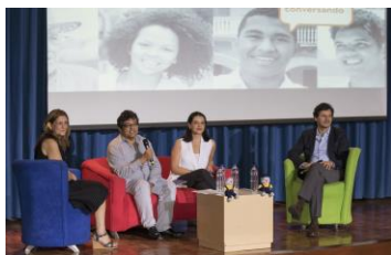
Invitados durante el panel