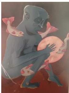
Primer lugar – pintura. Inmersión