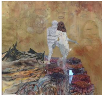
Segundo lugar – pintura. Cianuro y yo