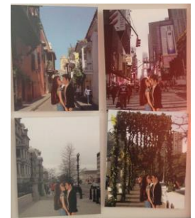
Segundo lugar - foto Vía dell' Amore

El 29 de octubre el Centro Cultural Cayena realizó la apertura de la exposición de las obras seleccionadas en el III Salón de Artistas Jóvenes de Uninorte . El jurado conformado por el Dir. Artístico del Salón, Roberto Angulo; la fotógrafa Vivian Saad y el artista plástico Ramiro Gómez, fueron los encargados de escoger 22 obras y los tres primeros lugares ganadores del Salón en las categorías de pintura y fotografía, de las 76 que presentaron 50 jóvenes estudiantes y egresados de Uninorte.