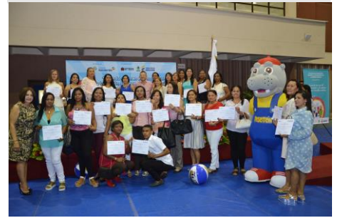
Graduación diplomado en alianza con el ICBF

Culminaron de manera exitosa los diplomados en desarrollo psicoafectivo y educación emocional que se llevaron a cabo en alianza con el ICBF. En total se graduaron 1.453 madres comunitarias de 7 departamentos del país, beneficiando también a 3.446 niños, niñas y sus familias con la aplicación del Programa Pisotón.